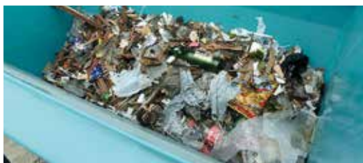
Beholder med affald

Alt, der er blevet frasorteret, transporteres ind i beholderen og kan derefter bekvemt tømmes.