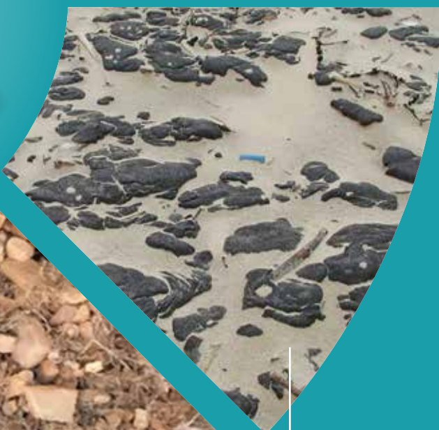
Olie og paraffin