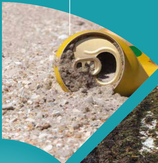
Plast og emballageaffald