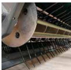
Pick-up klinge, pick-up rulle med fjedertænder

Den screenbare jord og urenheder i den opsamles.