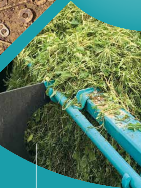
Planterester og ukrudt