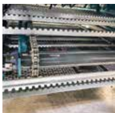
Pick-up klinge med transportsystem enhed