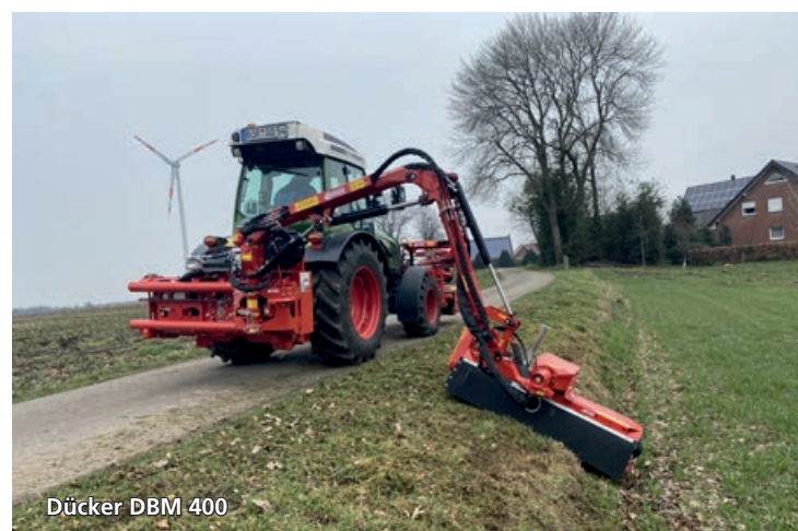
Dücker DBM 400