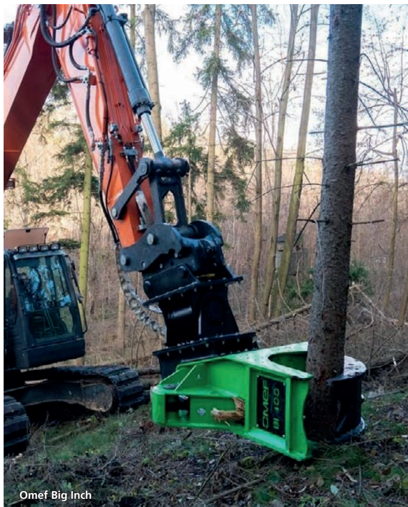
Omf Big Inch