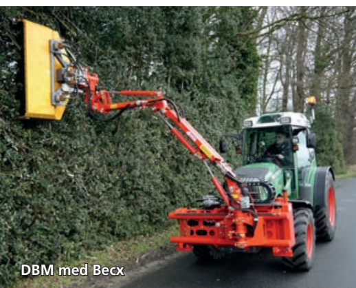
DBM med Becc