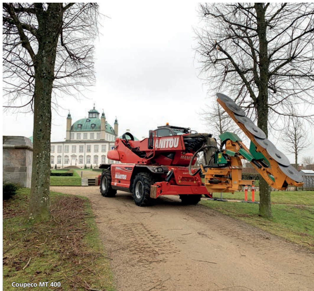
Coupeco MT 400