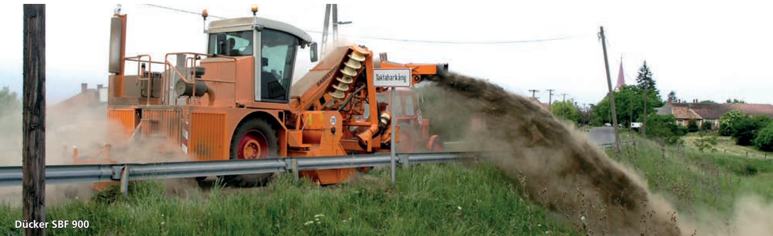
Dücker SBF 900