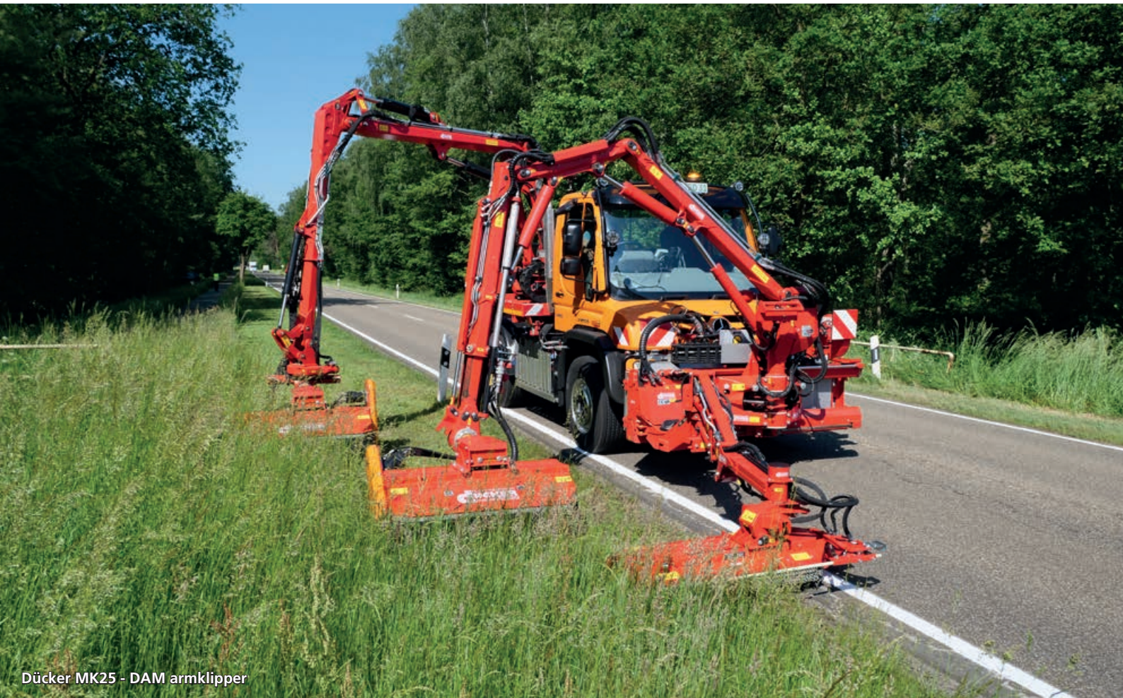
Dücker MK25 - DAM armklipper

»Individuelle løsninger tilpasset kundens ønsker og behov«.