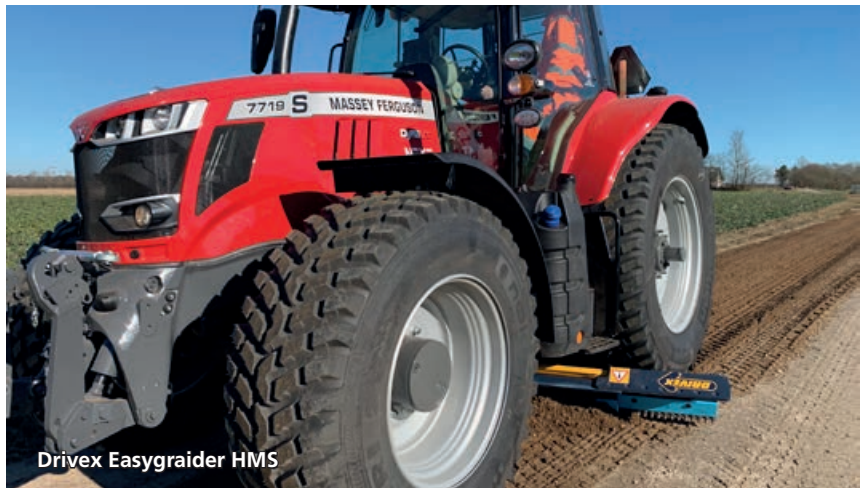
Drivex Easygrader HMS