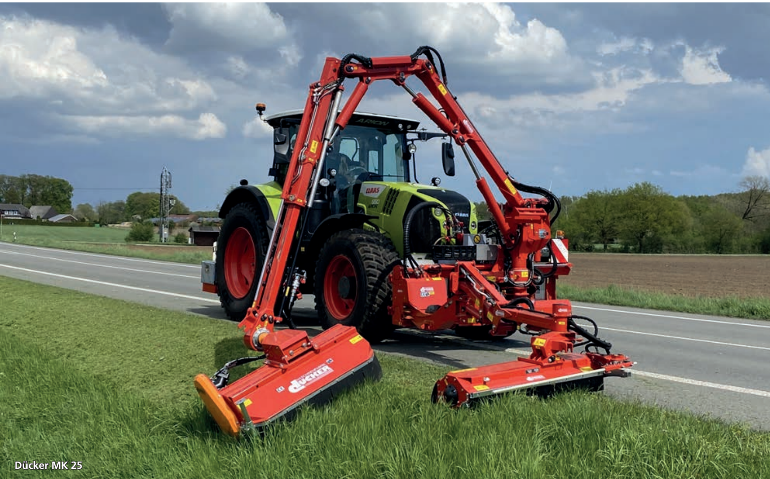
Dücker MK 25

»Vi tilbyder også slagleklipper, knuser, brostensbørste, gren- og hækkeklipper, savklinger, grøfterenser og dobbelt fingerklipper«.