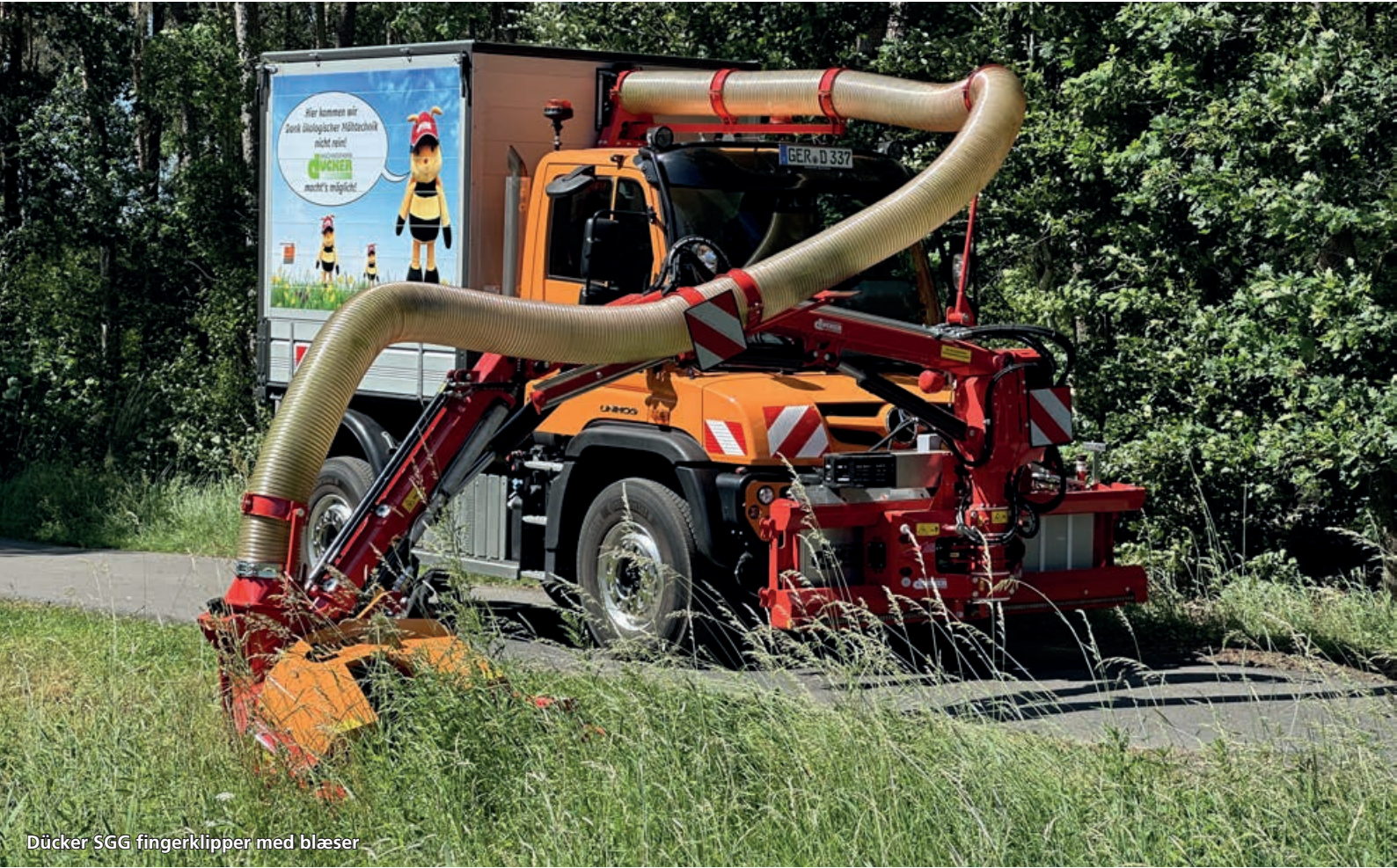
Dücker SGG fingerklipper med blæser