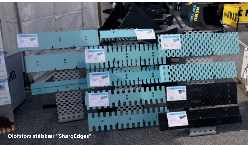
Olofsfors stålskær "SharqEdges"