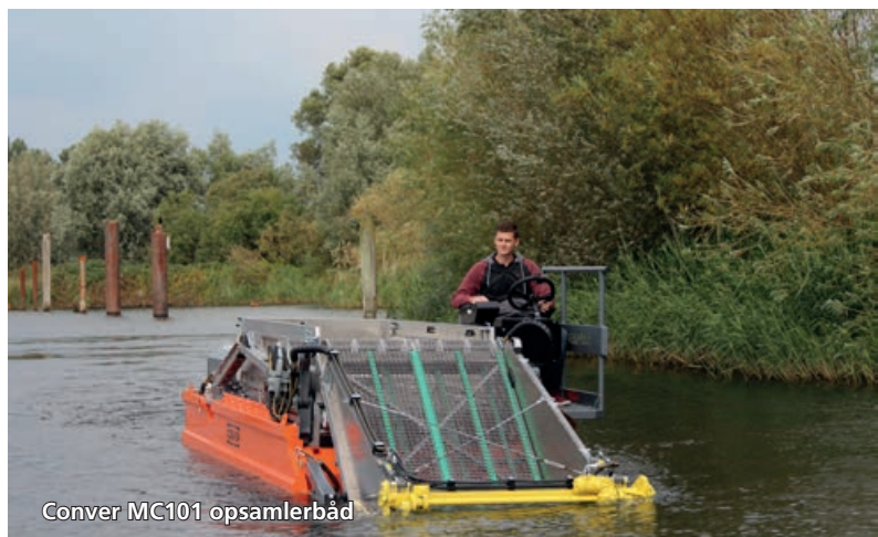
Conver MC101 opsamlerbåd