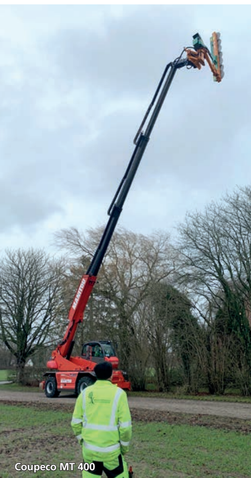
Coupeco MT 400