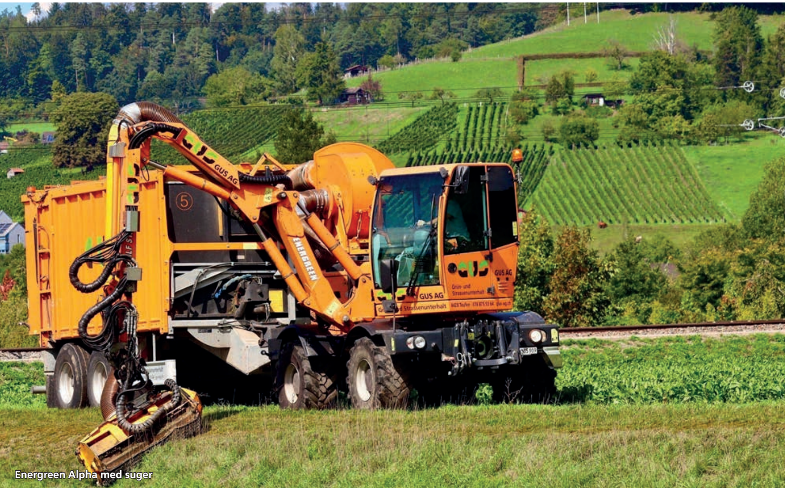
Energreen Alpha med suger