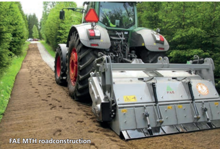
FAE MTH roadconstruction