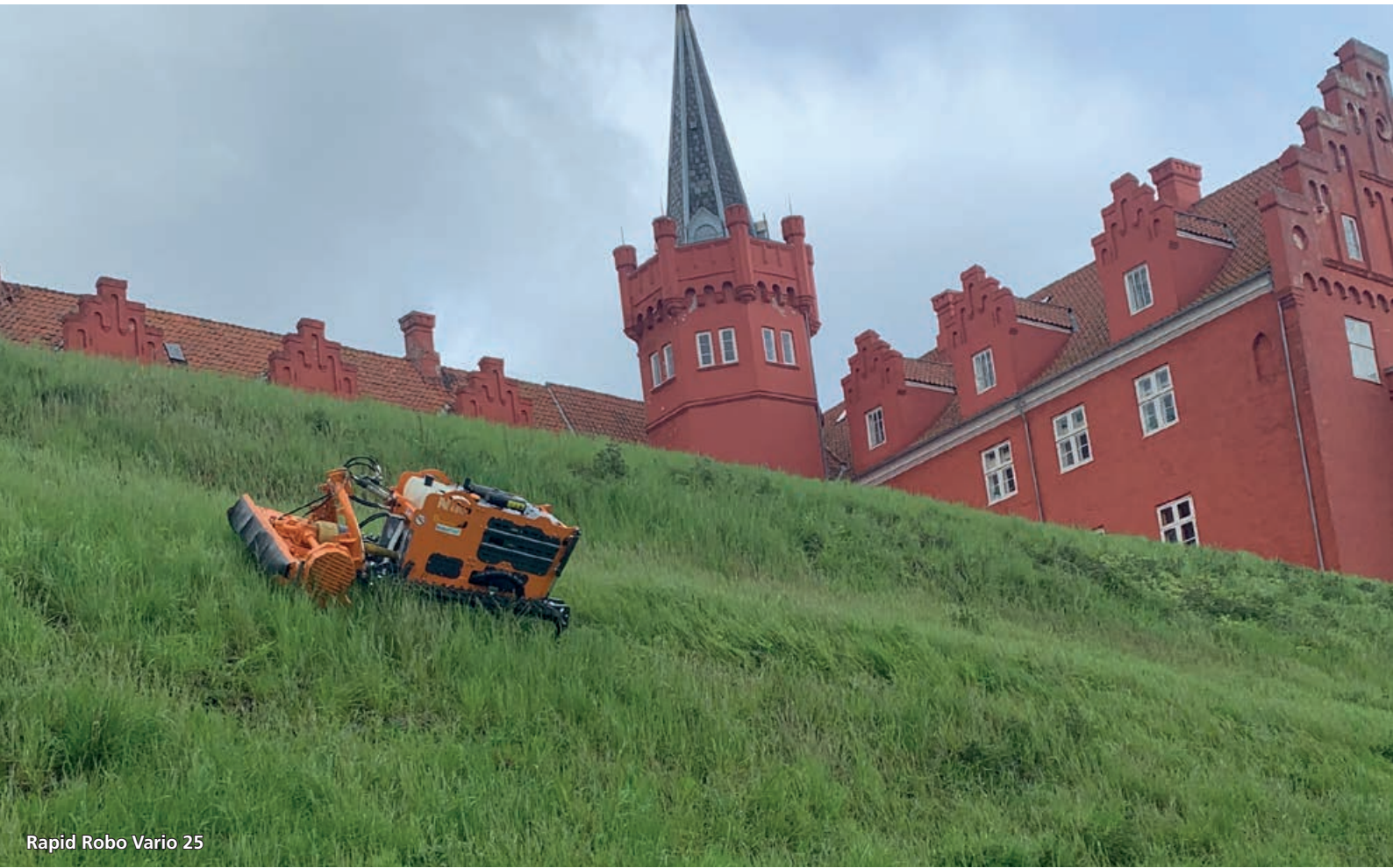
Rapid Robo Vario 25