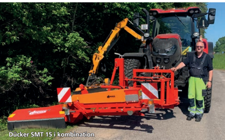
Dücker SMT 15 i kombination