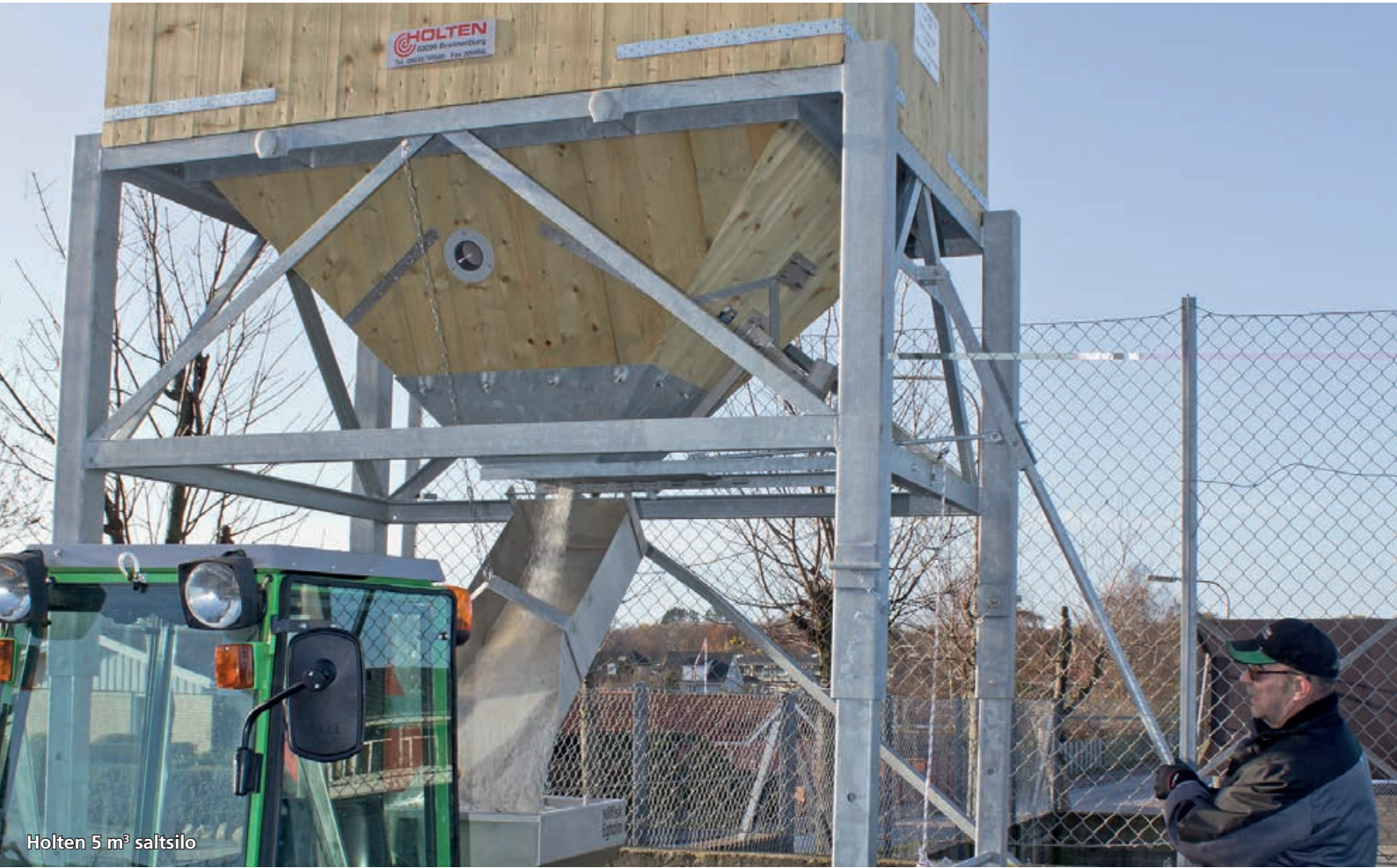
Holten 5 m³ saltsilo