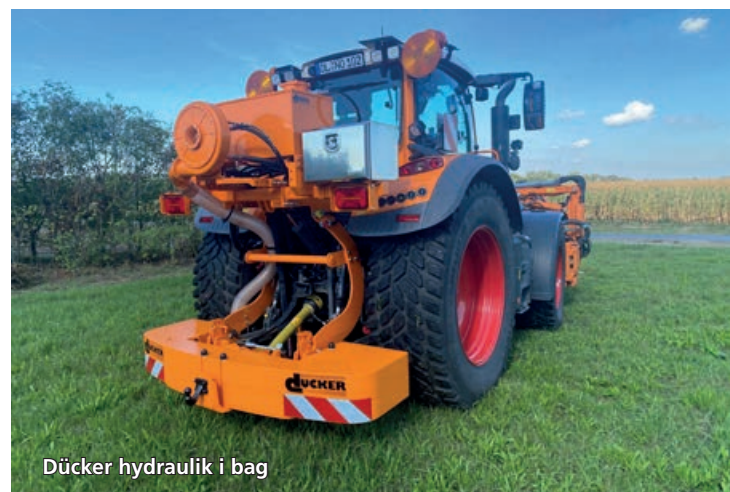
Dücker hydraulik i bag

»Vi tilbyder også slagleklipper, knuser, brostensbørste, gren- og hækkeklipper, savklinger, grøfterenser og dobbelt fingerklipper«.